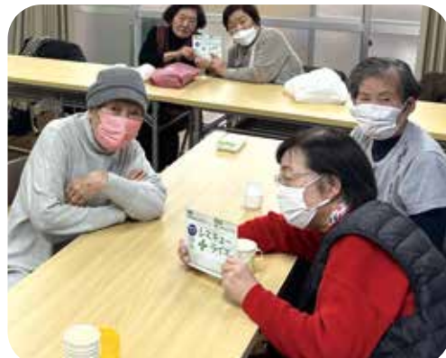
防災食を試食して「いざという時のつながり」を深めるサロン活動