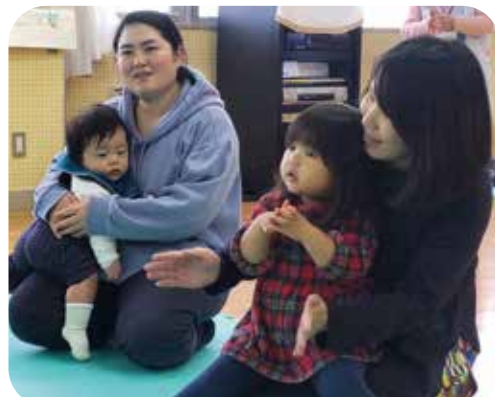
子育て中の親子がつながる居場所づくり

社協では、住民による地域福祉活動が活発に行われるように「寄付」を募っています。会費は住民同士の交流活動やフードバンクの運営等に活用させていただきます。多くの市民のみなさまのご支援、ご協力をお願いいたします。