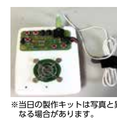
※当日の製作キットは写真と異なる場合があります。

講演会とラジオ製作会を同時開催。講座終了後は参加者同士の懇親会も予定。機械いじりが好きな方、ラジオ製作に興味のある方...お気軽にご参加ください。