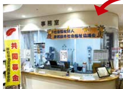
opsol 福祉総合センター2階に 受付があります。

社協では、生活上の様々な 悩み事の相談をお受けします。 社協が行う事業の活用や適切 な相談先につなぐことで、問題 解決のお手伝いをします