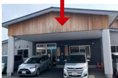
1階はデイサービス、2階は地域 包括支援センターがあります。