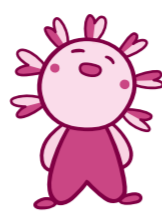
ポムネ 岸和田市協 イメージ キャラクター

発行所 岸和田市ボランティアセンター 〒596-0076 岸和田市野田町1-5-5 市立福祉総合センター 2階 ☎ 072(430)3366 FAX 072(431)1500