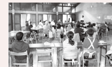
いきいきサロン活動の風景

委員・町会役員・ボランティアの人達にお世話になっています。次の担い手どうするか問題