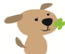
キャラクター「幸犬くん」

「幸犬くん」というイメージキャラクターが居て、権利擁護に関する普及・啓発活動にも積極的に取り組まれています。実は、キャラクターグッズが欲しいくらい「幸犬くん」の大ファンです！かわいい。