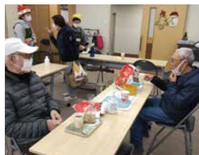
誰もが集えるリビング活動