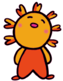
岸和田市社協イメージキャラクター『ボカボー』